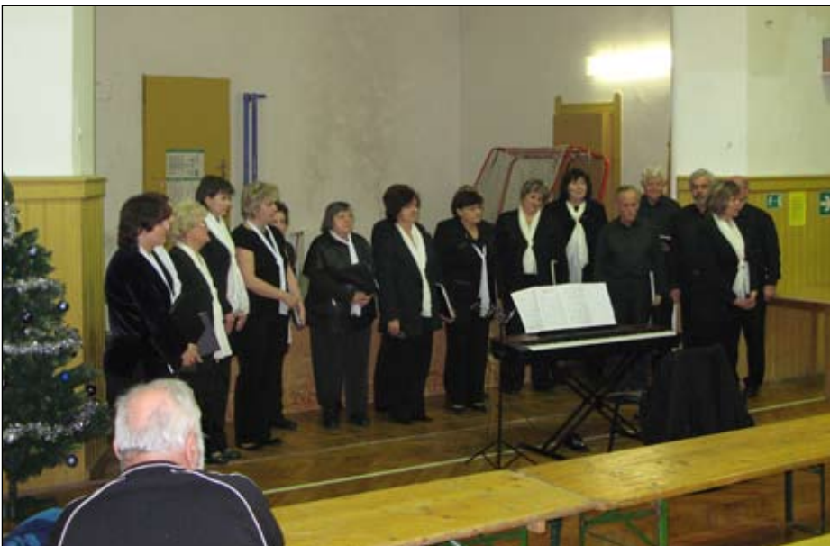
Ještě něco z kultury - adventní koncert souboru Slavoš