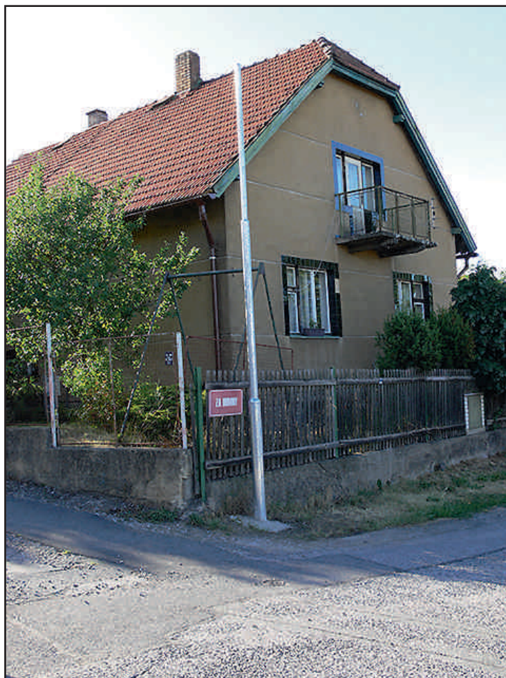
Stávající stav LED osvětlení