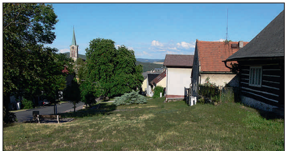
Neporušený zatravněný terén