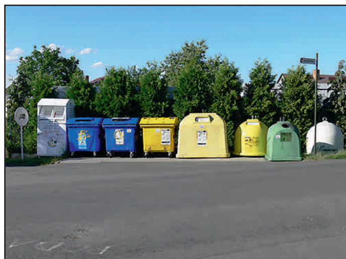
Rozšíření odpadových kontejnerů