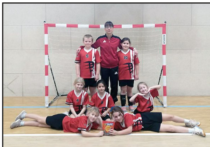
Poděbrady - PŘÍPRAVKA