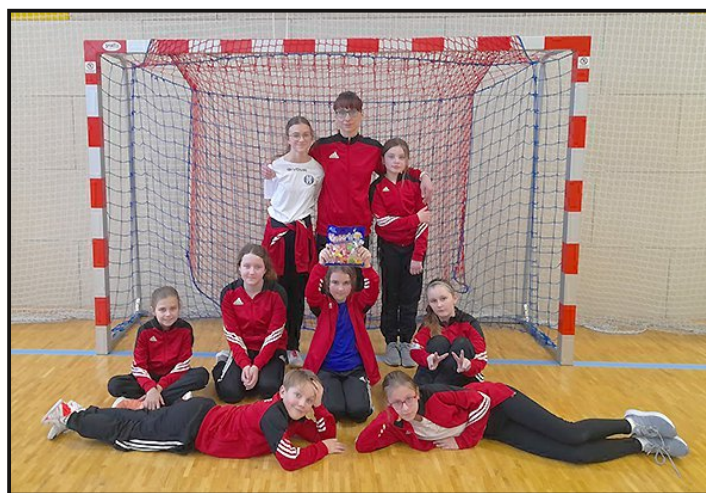
Poděbrady - MINI

Co se týká kategorie žactva, tak to se pilně připravuje na svá mistrovská utkání v jarní části soutěže středočeské ligy. První turnaj nás čeká už na konci března.