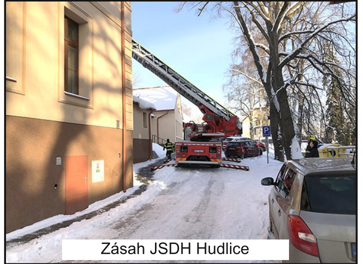
Zásah JSDH Hudlice