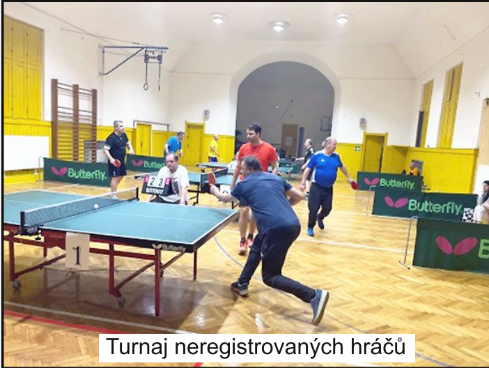
Turnaj neregistrovaných hráčů