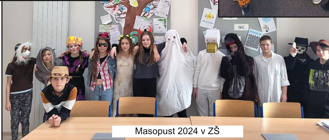
Masopust 2024 v ZŠ